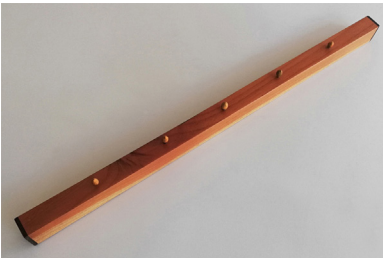
Javier Fresneda - Sin Título (Password), 2020. 60cm (largo), 3.5cm (alto), 2.7cm (ancho). Escultura, madera de cedro y ziricote, imanes de neodimio, huesos de aceituna. Único.