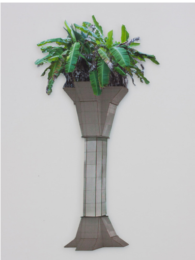
Oso Sánchez - Potasio K, 2020. Imagen digital impresa en vinil, corte láser sobre acrílico. 11 x 20 cm.