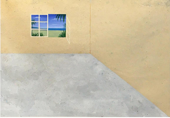
Ventana, acrílico sobre tela y madera. 60 x 40 cm, 2020